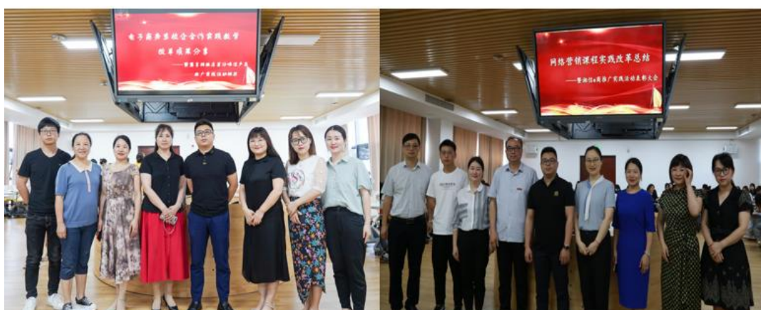
图 4 实践改革成果报告现场合影

1. 依托教改项目，《网络营销》被认定为 省级线上线下混合式一流课程 ，是 省级一流专业核心课程 。项目促进教师成长，基于实践教改成果已在公开场合开展多次成果报告（见图 4），获得学院、学校同行认可与推广。基于课内实践创建助农推广平台的改革经验已协同合作企业在校外同类院校推广。