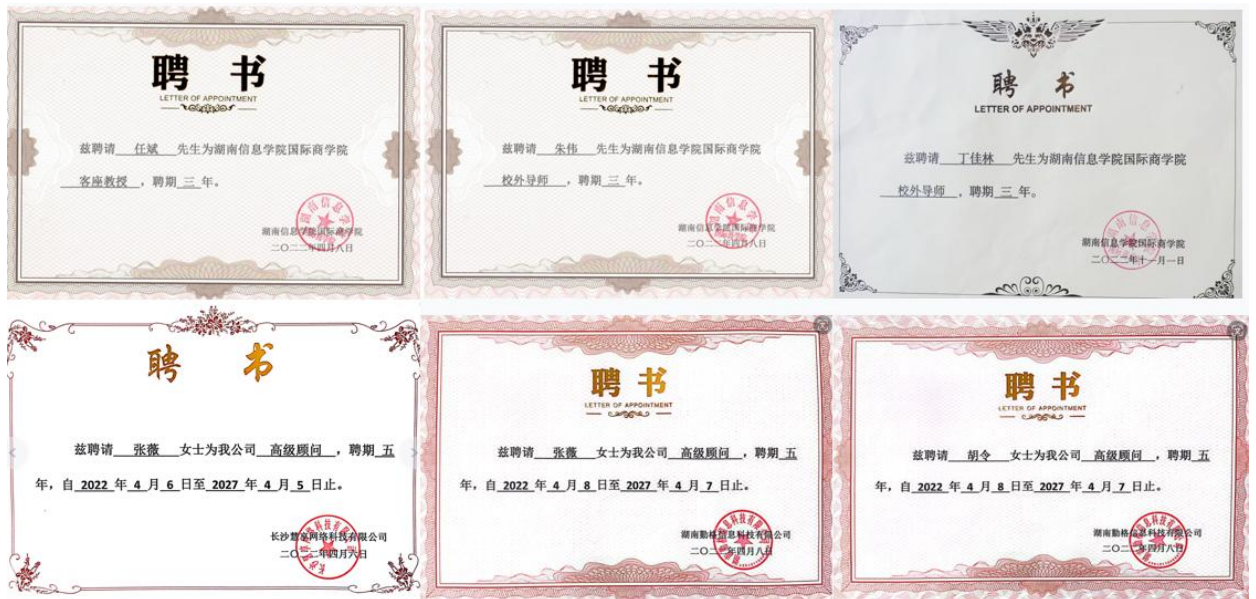
图 2 校企骨干互聘聘书