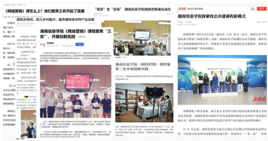
图 5 改革有关的省级媒体报道

革获得了华声在线等省级媒体报道和推广（见图 5），累计阅读数超十一万，实现了改革经验的有效推广。依托助农实践，师生积极参与区域社会治理与服务、“走近千村观察，助力乡村振兴”专项活动、青年红色筑梦之旅、“乡村振兴，电商助农”长沙县首届直播大赛等，带动村民开展网络营销推广实践，切实助推省区域乡镇农副产品网络推广，为更多“一村一品”特色产品缔造和推广奠定了基础。