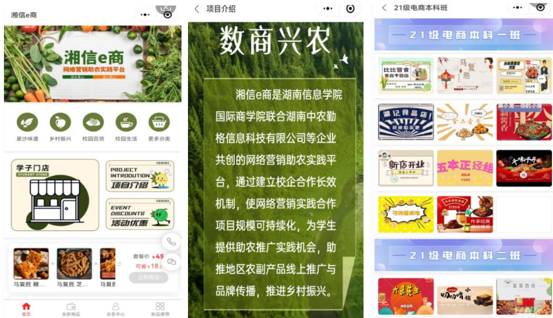
图3 “湘信e商”小程序界面图

比颁奖等多元形式展开激励与评价。在学子门店社会化媒体营销实践等课内实践模块、校地企助农课外实践模块任务中，将学生 诚信的表现 作为贯穿始终的重要考评指标。